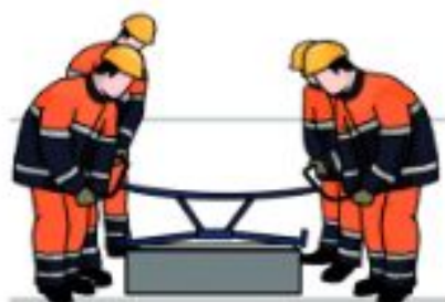
Rys. 4 Przenoszenie nieporęcznych przedmiotów za pomocą kleszczy brukarskich